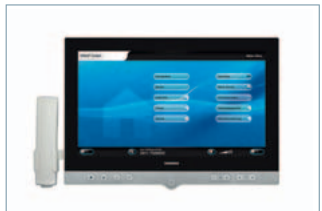
Cockpit 18 IP