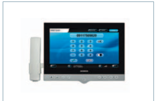
Cockpit 12 IP